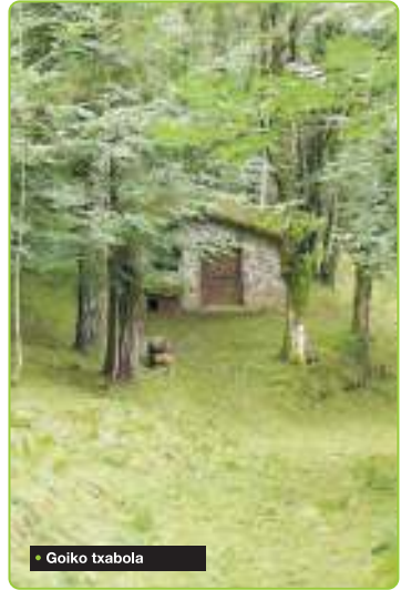
• Goiko txabola

“Hor, hegitik, arratsaldetan hiru artalde jaisten ziren: Zuatzu bixkarkoa, Peruena eta Ardantzakoa. Garaikoak Tontor aldean moldatzen ziren. Txistu hotsak ondo entzuten ziren”.