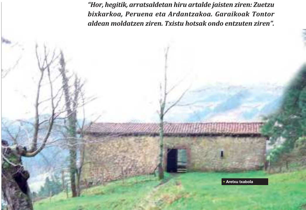
• Aretxu txabola